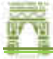
Tabla 3 Principales metas de Fin, Propósito y Componentes