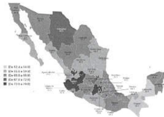
Casos de violencia contra las mujeres (ENDIREH)