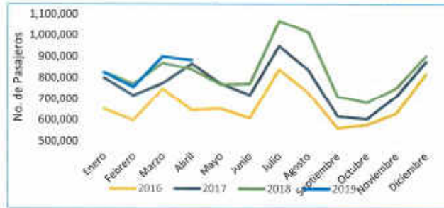
Grafica 2: Pasajeros que utilizan las rutas federal náutica de Isla Mujeres, Cozumel y Chetumal en tránsito general