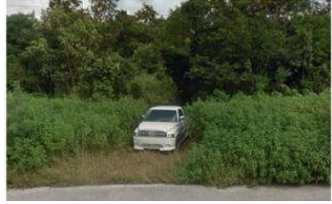
Descripción imagen: Acceso a la zona de captación, camino estrecho con vegetación