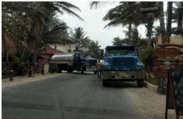
Descripción imagen: La zona costera de Tulum es abastecida por pipas de agua potable