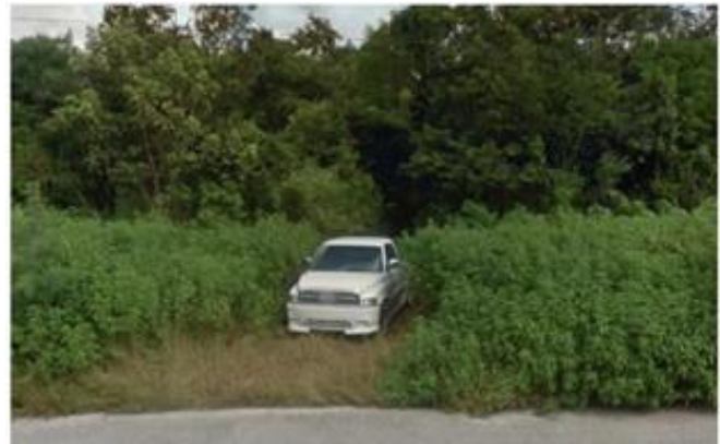
Descripción imagen: Acceso a la zona de captación, camino estrecho con vegetación