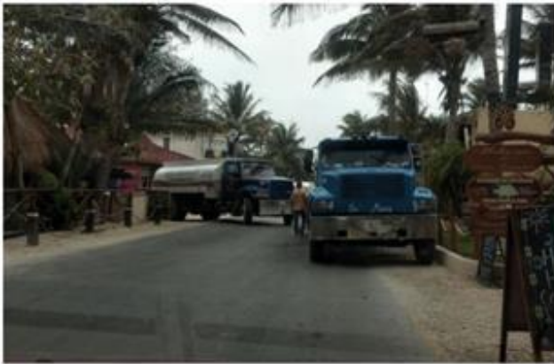
Descripción imagen: La zona costera de Tulum es abastecida por pipas de agua potable