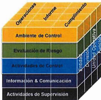
Esquema 1. Cubo COSO. Componentes

La evaluación fue realizada a los cinco componentes del COSO: