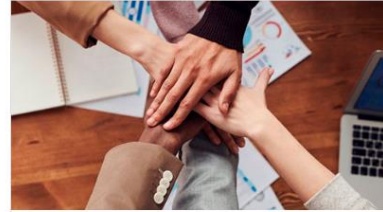
Comité de Control y Desempeño Institucional (COCODI)