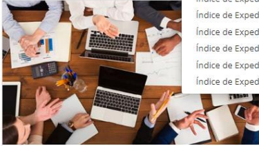
Comité de Ética y Prevención de Conflictos de Interés (COEPCI)